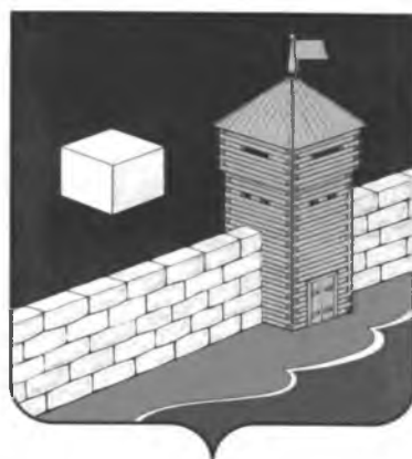
СХЕМА ТЕПЛОСНАБЖЕНИЯ ЕТКУЛЬСКОГО СЕЛЬСКОГО ПОСЕЛЕНИЯ НА ПЕРИОД ДО 2027 ГОДА (актуализация на 2023 год)

УТВЕРЖДЕНА: Постановлением администрации Еткульского муниципального района от 30 июня 2022 г. № 436